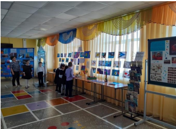
12 апреля-всемирный день Космонавтики