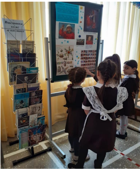
Выставка книг и рисунков о космосе