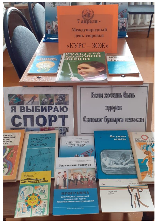
7 апреля – всемирный день здоровья